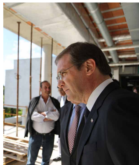
visita à Santa Casa da Misericórdia da Póvoa de Varzim, distrito do Porto.

Pedro Passos Coelho considera que “não há nenhuma razão” para Portugal ser sancionado pela União Europeia e o PSD “não alinha em lutas” contra as instituições europeias. “Não há nenhuma razão pelo passado para falar em sanções (...). A questão das eventuais sanções a Portugal é uma falsa questão”, destacou Pedro Passos Coelho, que falava aos jornalistas à margem de uma