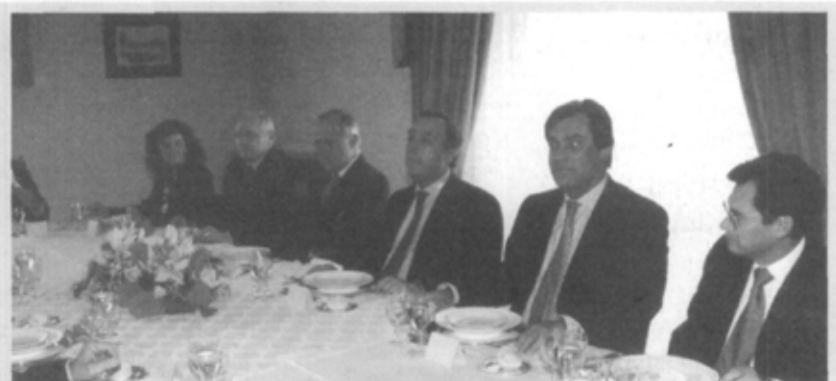
Na sequência dos encontros para troca de impressões periódicas com os diplomatas acreditados em Lisboa, Marcelo Rebelo de Sousa ofereceu um almoço aos embaixadores dos países da América Latina. O tema central do encontro foi a primeira Cimeira UE-América Latina, a realizar no Rio de Janeiro, em Junho deste ano