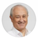
Rui Rio ✓ @RuiRioPSD

Se a Covid-19 ocorreu depois da venda do Novo Banco em 2017, como é que o desgraçado contrato (que não se conhece) pode permitir uma coisa destas? O que mais há são empresas que precisam de mais dinheiro devido à pandemia; e o Fundo de Resolução, leia-se o Estado, paga-lhes?